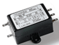
Ontstoorder 3A € 6,75