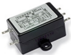
Ontstoorder € 4,95